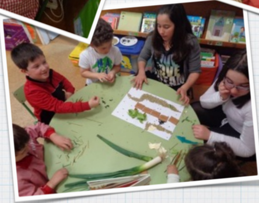
traballando cos compañeiros maiores

Experiencias reais de tarefas nas aulas de infantil e primaria